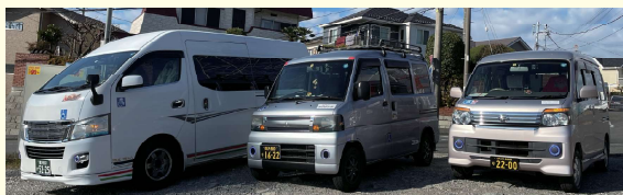
大型車 普通車 (軽自動車)

※ 営業区域について：介護タクシーの営業区域は神奈川県全域を、出発地または到着地とする。